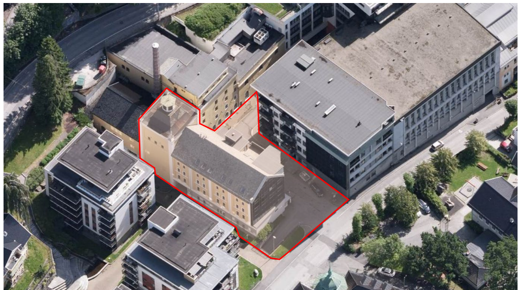
2 - Skråfoto av planområdet