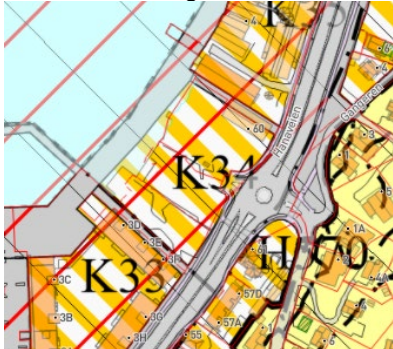
Figur 1 – utsnitt av sentrumsplan- felt K34

Maks 70 % bolig; Inntil 3000m 2 BRA detaljhandel langs Hanaveien.